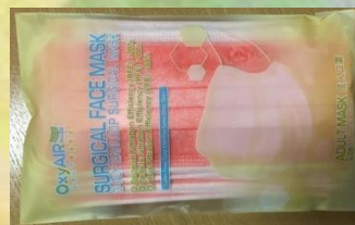
上圖為1小包(每盒有3小包)