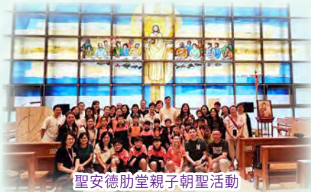
聖安德肋堂親子朝聖活動