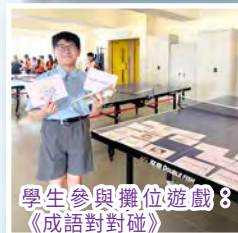
學生參與攤位遊戲：《成語對對碰》