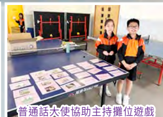
普通話大使協助主持攤位遊戲