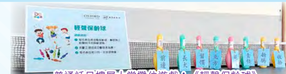
普通話日樓層大堂攤位遊戲：《輕聲保齡球》

本科致力營造普通話語境，提高學生學習動機及興趣，以逢星期一的普通話日為主軸，向低年級學生以「請跟我說普通話」作互動遊戲，另為高年級學生開設不同針對普通話學習難點的攤位遊戲，包括輕聲、兒化及廣普對譯等主題的遊戲，讓學生在遊戲中學習。此外，本科透過聯課活動時間培訓高年級學生作普通話大使，協助主持攤位遊戲，與低年級學生以普通話互動，亦率領他們參與全港性校際比賽，讓他們拓寬視野且更有自信地運用普通話。