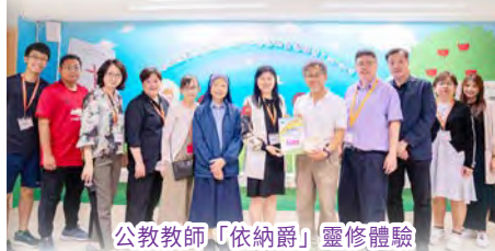
公教教師「依納爵」靈修體驗