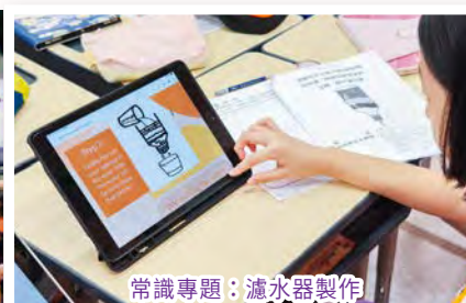
常識專題：濾水器製作