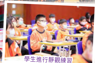
學生進行靜觀練習