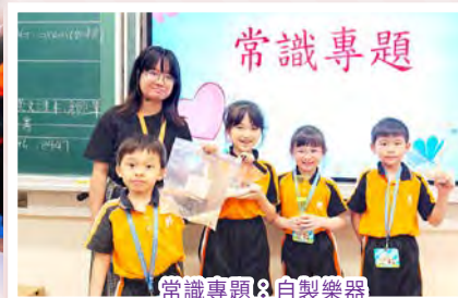
常識專題：自製樂器