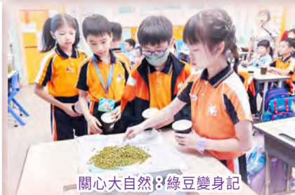
關心大自然：綠豆變身記