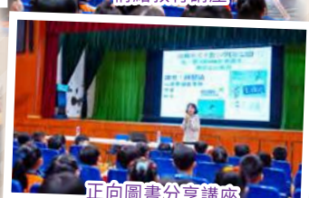
正向圖書分享講座