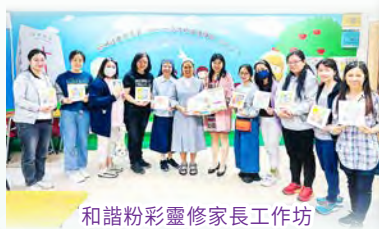
和諧粉彩靈修家長工作坊