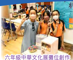
六年級中華文化展攤位創作