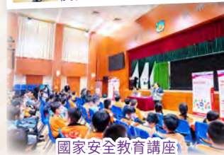
國家安全教育講座