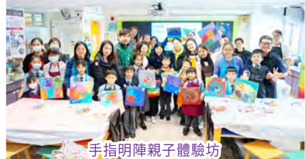
手指明陣親子體驗坊