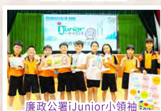
廉政公署 Junior 小領袖

生涯規劃教育是持續和終身的過程，讓學生在人生不同階段達成不同的目標。學校在德育課程中加入生涯規劃元素，培養高小學生認識自我、個人規劃、設立目標和反思的能力，以及認識升學及事業發展的機會和選擇。