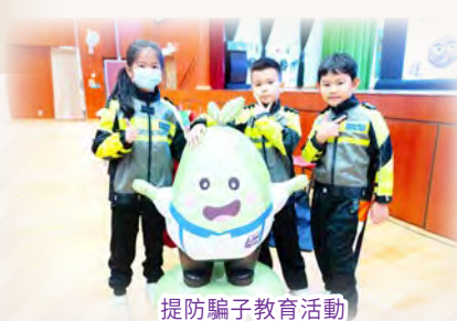
提防騙子教育活動

價值觀教育是全人教育的重要元素，學校德育及國民教育組會依據天主教教育五大核心價值及教育局建議培育學生的首要價值觀，制定校本價值觀教育框架，建構六大「油天海泓畢業生特質」，培育學生正確的價值觀和態度；幫助他們在成長的不同階段，當遇上難題的時候，懂得辨識當中涉及的價值觀，作出客觀分析和合理的判斷，並付諸實踐，方能面對未來生活上種種的挑戰。