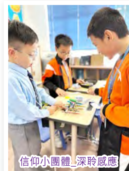
信仰小團體_深聆感應