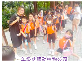
二年級參觀動植物公園