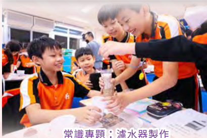
常識專題：濾水器製作