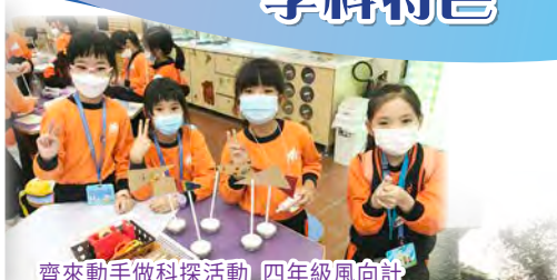
齊來動手做科探活動_四年級風向計