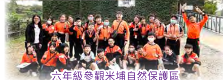
六年級參觀米埔自然保護區