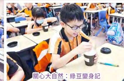
關心大自然：綠豆變身記