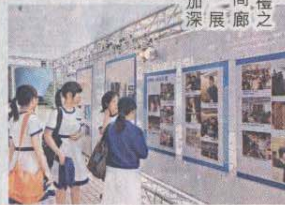
大會除了舉辦典禮之外，還舉辦「時間廊」歷屆發展回顧展覽，讓大家可以更加深入認識是次計劃。