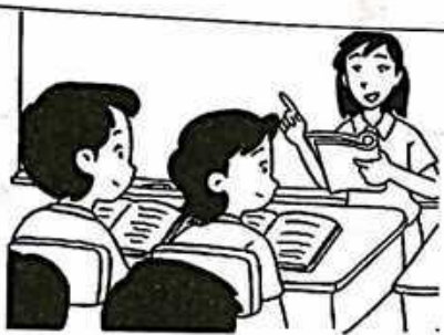
1. 講課 認真