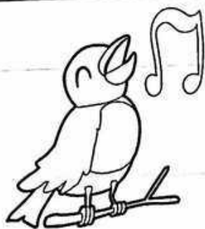
3. 唱歌 動聽