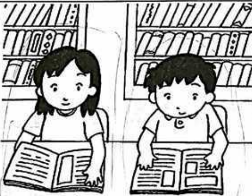
2. 閱讀 安靜